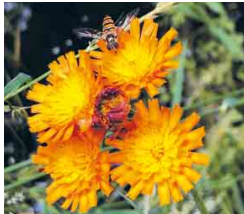
Snor zweefvlieg op oranje havikskruid.

In Dordrecht werken de gemeente, maatschappelijke organisaties, bedrijven en bewoners samen aan het verbeteren van de kwaliteit van de leefomgeving. Dat doen we door het toevoegen van natuur (groen) en water (blauw). Zo verhogen we het welzijn van de Dordtenaren. Tegelijk maken we de stad klimaatbestendig en helpen we de natuur. Meer informatie over onze opgave vind je op www.groenblauwdordrecht.nl .